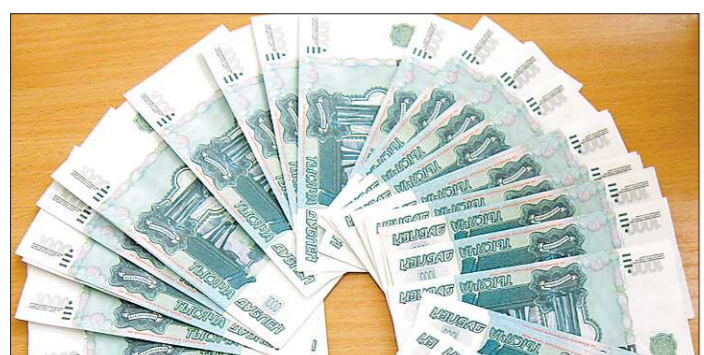
А с виду и не отличишь