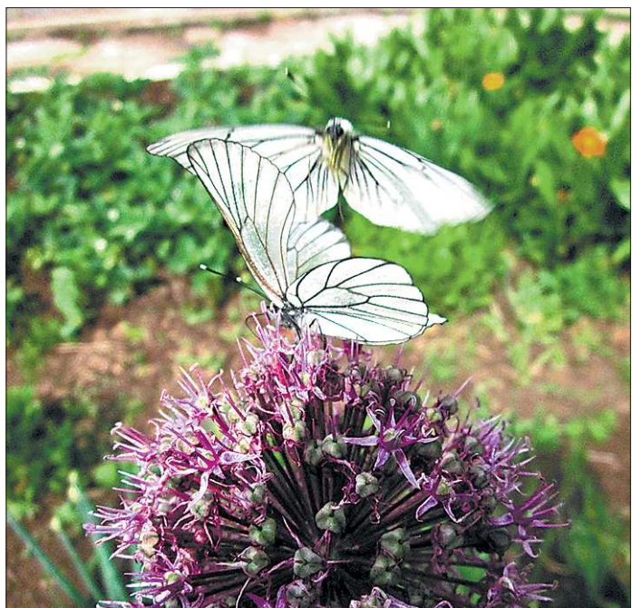
На большое количество боярышницы уральцы обратили внимание ещё в прошлом году, однако нынешний сезон бьёт все рекорды