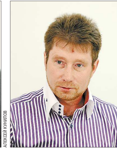
Алексей Баталов: Надо преобразовать СанПиН из глупых в мудрые