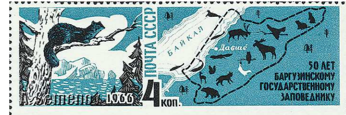
Самый дорогой мех, которым обладает в основном баргузинский соболь, обитающий в Прибайкалье, называется «чёрный алмаз»

Цвет соболя очень широко варьируется — от песчано-желтого до почти чёрного. Чем мех темнее, тем он дороже. На экспорт Россия всегда поставляла в основном именно чёрный мех, и для европейцев слова «чёрный» и «соболь» стали синонимами. Например, в геральдике чёрный цвет официально называется соболем (sable). А простые жители Запада, когда хотят, к примеру, описать свою чёрную кошку, до сих пор говорят, что она — соболиного цвета.