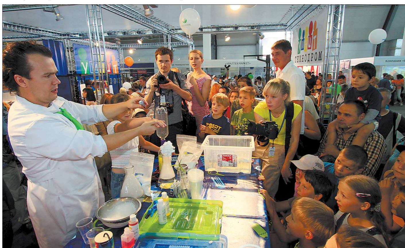
К 2020 году Иннопром должен дорасти до Экспо, «повзрслеть», как повзрслет его нынешние юные посетители