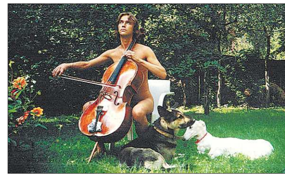
Олег не в первый раз шокирует публику. Например, эту фотографию он разместил в личном Интернет-альбоме

Олег Ведерников родился в 1966 году в Свердловске. Неоднократно выступал с сольными программами в России и зарубежом. Является первым исполнителем сочинений ряда авторов, написанных специально в расчете на его исполнительские возможности. Лауреат множества международных премий. С Пекинским симфоническим оркестром сотрудничал с 2002 года.