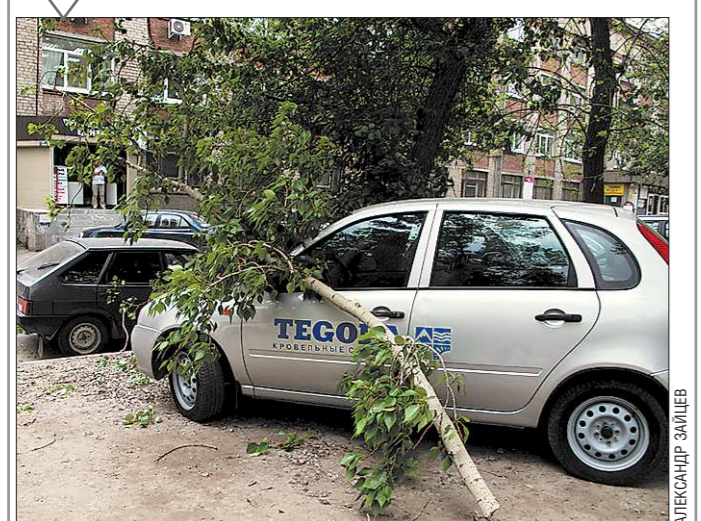
22 мая около 15 часов на Екатеринбург обрушился мощный ураган. Последствия природного катаклизма были трагическими: на одной из городских стройплощадок погиб 36-летний рабочий. Пострадали некоторые жилые дома — порывами ветра с них сорвало кровли, автомобили — упавшие деревья разбили крыши и стекла, в аэропорту Кольцово были отложены два рейса