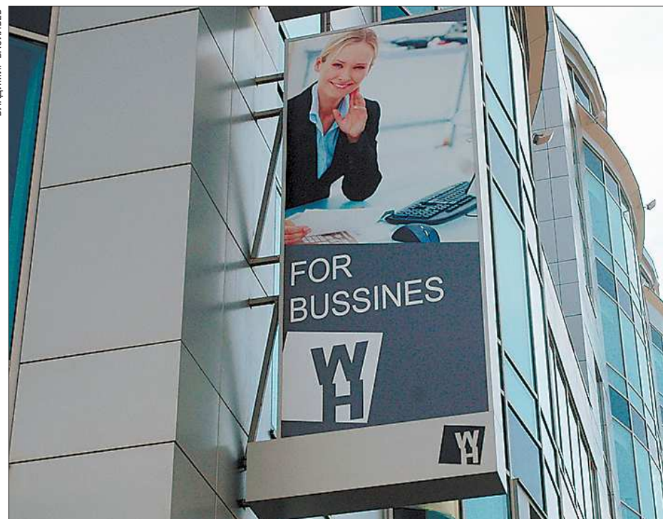
Странно, что никто из уважаемых бизнесменов, работающих в этом офисе, не обратил внимания на очевидную ошибку