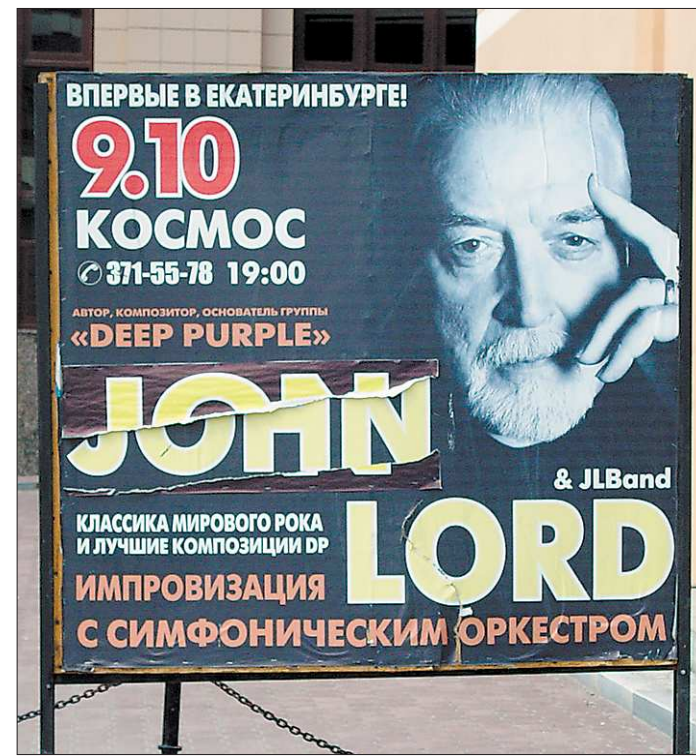
Кажется, что Лорд упрекает нас взглядом — эх, вы, неучи...