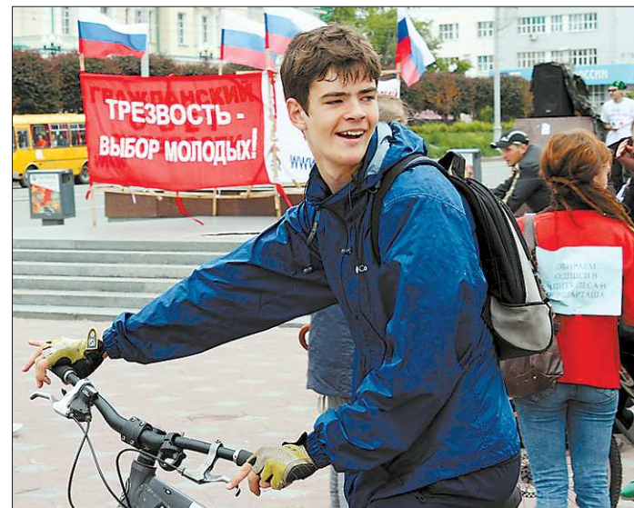
Если бы слово всегда подкреплялось делом...

Между тем на сегодняшний день, как показывают многочисленные общественные рейды, акции народного контроля и просто ежедневная практика, далеко не все