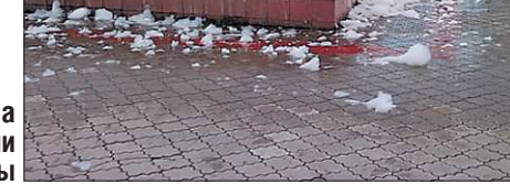
А.Р.М.Б. ЗАРЯ УРАЛА

Моющие средства хулиганы подливали дважды