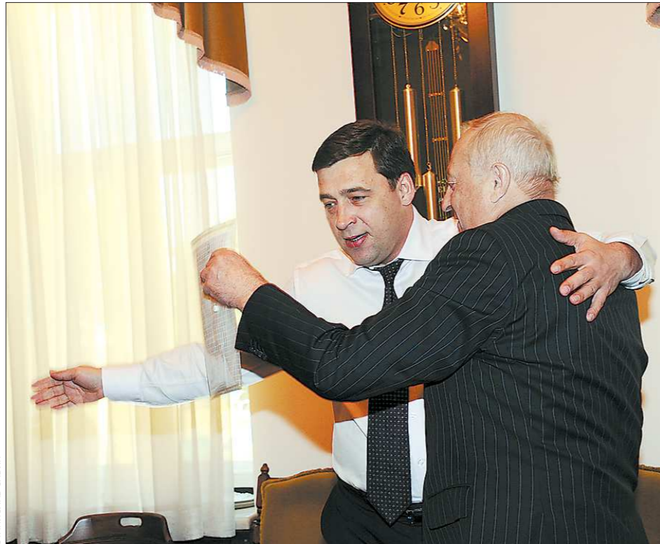
Дружеские объятия. Так неформально встретились Евгений Куйвашев и Эдуард Россель

Эдуард Россель отметил, что хорошо знает Евгения