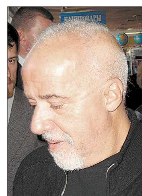
В Екатеринбурге Козьмо провел два дня

В 2006 году в Екатеринбург приехал всемирно известный бразильский писатель Пауло Козьмо. Визит Козьмо в столицу Урала проходил в рамках турне писателя, которое он совершил по железной дороге из Москвы во Владивосток. О его приезде было известно заранее, поэтому в Екатеринбурге съехалось немало поклонников его таланта. Автограф-сессии он проводил в «Доме книги», а случайным образом отобранных читателей даже приглашал на вечеринку. На второй день визита Пауло дал несколько интервью местным СМИ, в числе которых была и «ОГ».