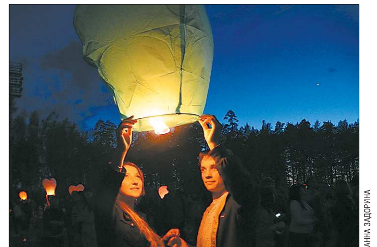
Среди азиатских народов существует поверье: если любящая пара запустит в небо такой фонарик, любовь вспыхнет с новой силой

Отметим, что участники акции узнали о запуске фонариков из группы «Типичный Асбест» в социальной сети «ВКонтакте». Первое подобное мероприятие было организовано в начале мая. Планируется, что акция станет традиционной.