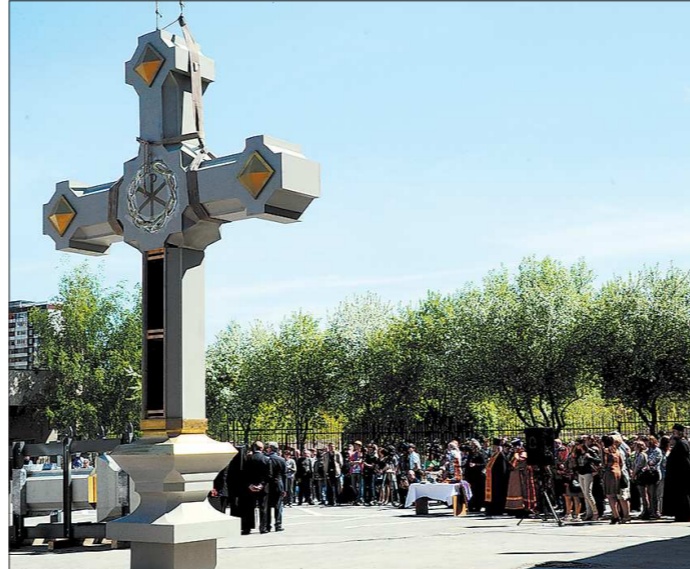
Прежде чем взяться за гранит, специалисты художфонда изготовили деревянный макет креста. В день отправки на вершиях в Севастополь «Черновики» показали журналистам

Заказ на изготовление святыни поступил специалистам фонда от руководителей Ямало-Ненецкого автономного округа. К ним в свою очередь обратились моряки подшефного ЯНАО десантного корабля «Ямал» с просьбой помочь воссоздать точную копию прежнего завершения. Это будет уже третий по счёту крест, венчающий купол храма со 155-летней историей. Первый был полностью разрушен снарядом в годы Великой Отечественной войны, падающая каменная глыба при этом заметно повредила стены храма. Позже на его месте установили аналог, который внешне ничем не отличался от прежнего, но был выполнен не из гранита, а из магматического диорита. Кстати, по мнению многих специалистов, причиной последующего обрушения в 2010 году, когда от креста откололся значительный