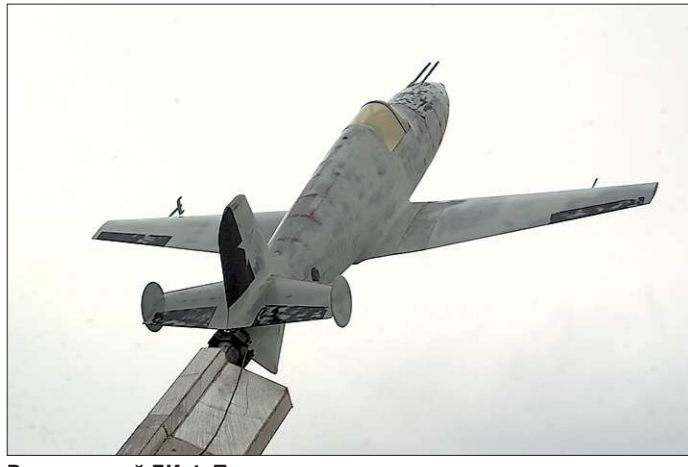
Взлетающий БИ-1. Памятник перед зданием аэропорта Кольцово