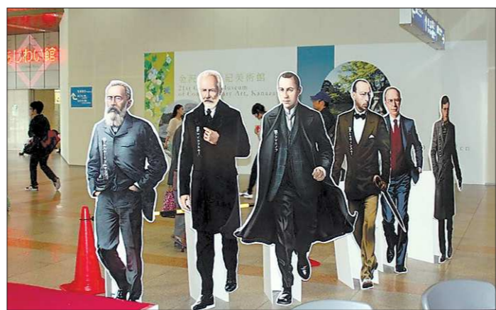
Русская музыка и великие композиторы были заметны, начиная с вокзала в Токио