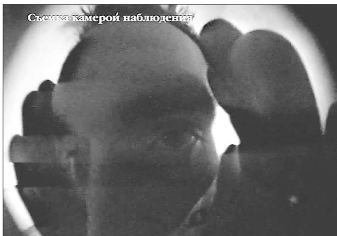
Съемка камерой наблюдения

Если до этого каждый визит воров в квартиру воспринимался как ЧП районно-