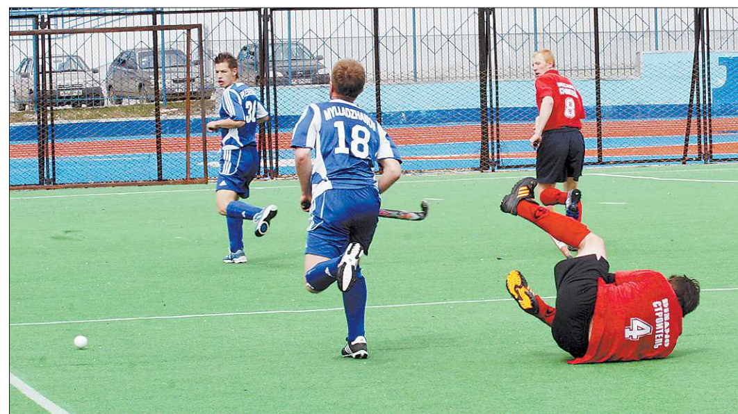
Хоккеисты «Динамо-Строителя» получили в Казани чувствительный удар по своему самолюбию