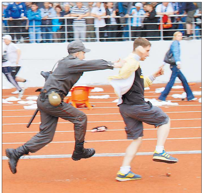
Убежать от нашей полиции столичным хулиганам не удалось