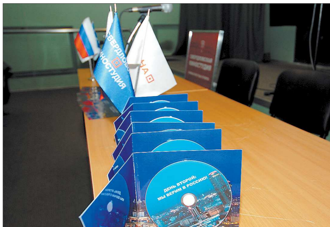
Диски с фильмом отправят на все предприятия Свердловской области, сотрудники которых принимали участие в митинге

В четверг, 3 мая, накануне инаугурации Президента РФ, в Екатеринбурге состоялся пресс-показ кинопроекта.