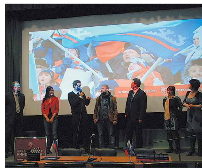
Презентуя свой проект на пресс-показе в Екатеринбурге, авторы картины заметно волновались, так как на одной сцене с ними были и герои фильма