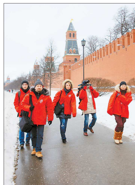
Бригаду киностудии было видно издалека