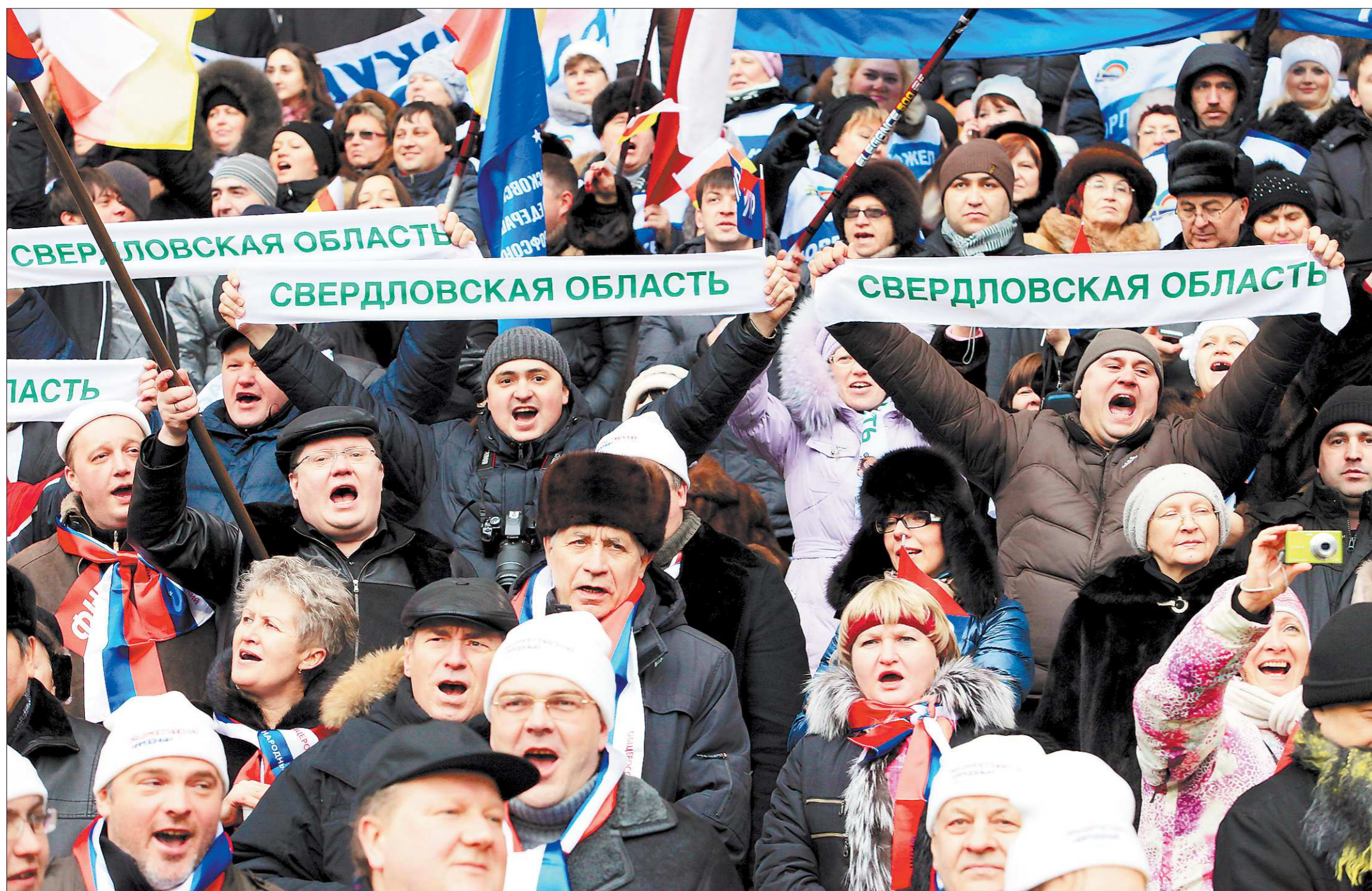
Свердловская делегация в «Лужниках» – самая крупная из региональных: почти 850 человек, около 600 из которых добрались до Москвы спецпоездом

На Среднем Урале кинематографисты продолжают рассказывать о человеке труда и престиже рабочих профессий