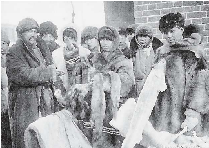
На ярмарке, XIX век.

заблудиться, по какой бы дороге ты ни пошел – всё равно придёшь к торговой площади. Дело в радикальной планировке Ирбита, при которой от главной торговой площади, где расположен Пассаж, лучами отходят все остальные дороги. Во времена расцвета ирбитской ярмарки город был богат красивыми архитектурными сооружениями: гостиный двор, дома купцов, здания банков... Сейчас большинство из них светят пустыми окнами. И, вероятно, чтобы не пугать гостей современных ярмарок, эти разрушившиеся дома однажды «нарядили» в огромные баннеры, на которых нарисованы окна.