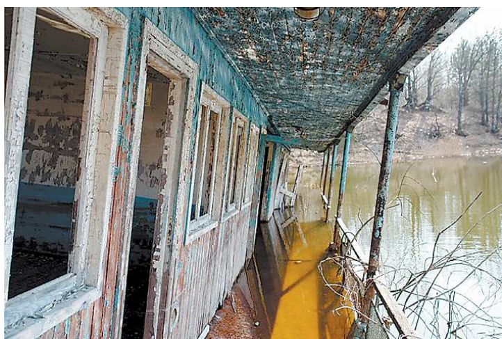
Современный Чернобыль местами выглядит так, как был брошен 26 лет назад. Трагедия сломала жизни города и многих людей.