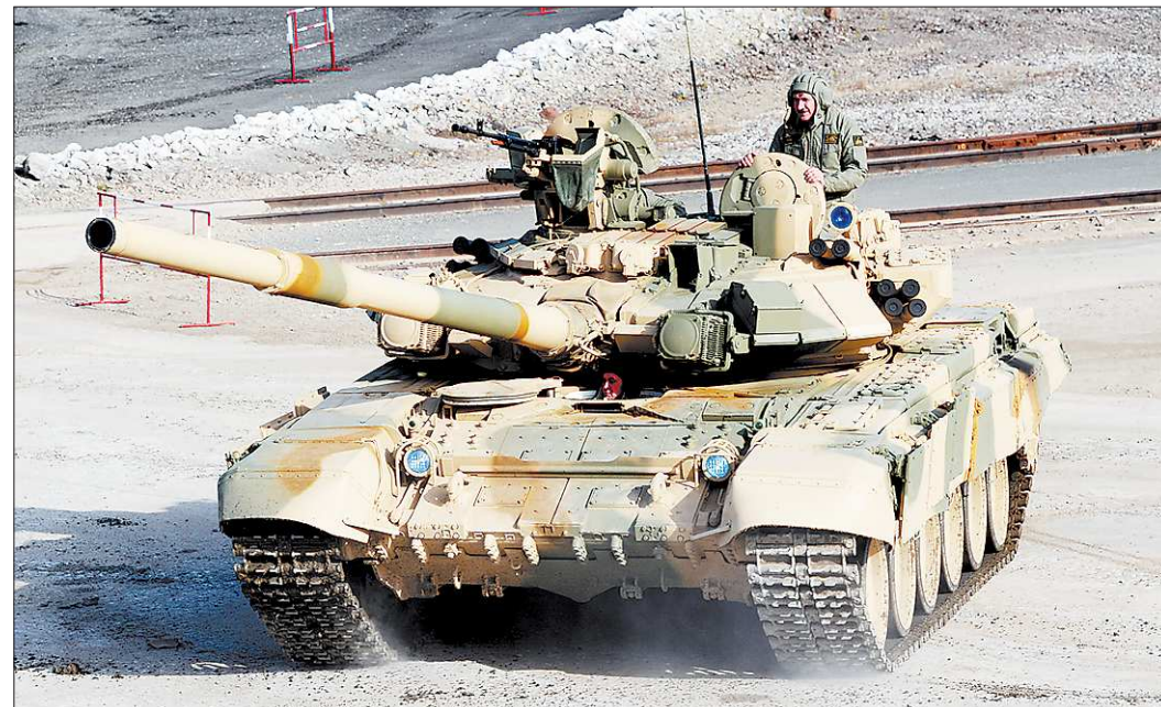
Экспортно-ориентированный Т-90 в этом году был представлен на многих международных военных выставках

В ходе военной реформы Вооружённые силы России отказались не только от танковых армий, но и от танковых дивизий — в строю остались лишь несколько компактных танковых бригад. Им такое огромное количество боевой техники не нужно, но именно в это время Уралвагонзавод разработал и приступил к производству Т-90. У реформируемой Российской армии средств на их закупку не было, поэтому заводу и позволили (впервые в нашей истории) поставлять на внешний рынок новую машину, которой ещё не вооружили свои части. Одновременно уральские конструкторы предложили программу глубокой модернизации танков Т-72, позволяющую приблизить их боевые возможности к Т-90. И се-