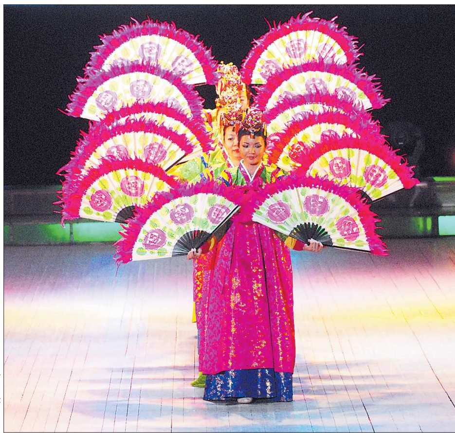
Этот танец в переводе с корейского называется «Счастье». Правда, красиво?

Порадовало, что в этот «день дружбы» и зрители в зале были как-то особенно доброжелательны. Кричали «бис!» не только зажигательному цыганскому ансамблю (цыганские артисты умеют расшевелить любую публику), но и лирическому корейскому танцу де-