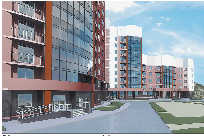
Общежитие для преподавателей будет приятно отличаться от студенческих. По крайней мере, сегодняшних