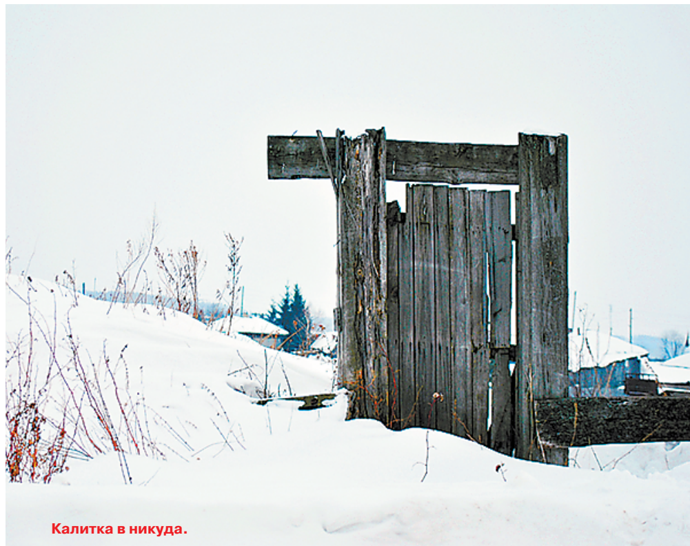
Калитка в никуда.