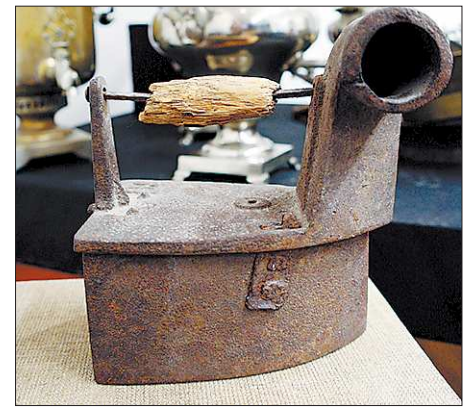
Угольный утюг с трубой начала XIX века