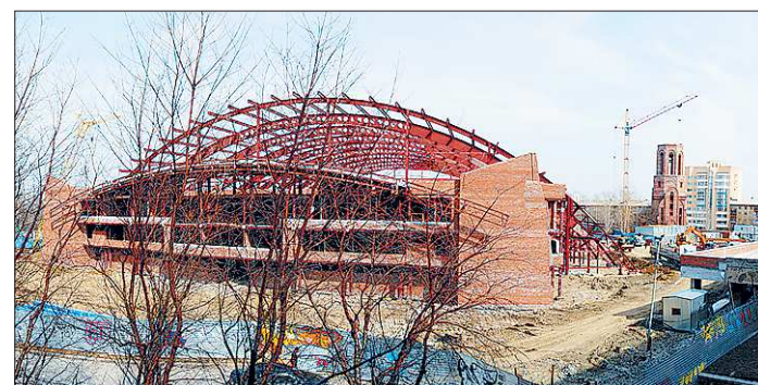
Строительство крытого футбольного манежа идёт полным ходом

За шесть туров до конца первенства России среди клубов Футбольной национальной лиги екатеринбургский «Урал» сохраняет теоретические шансы на четвертую позицию, а значит, и на переходные матчи за место в Премьер-лиге в сезоне 2012/2013. Правда, на днях на пути «шмелей» в элиту возникло ещё одно препятствие.