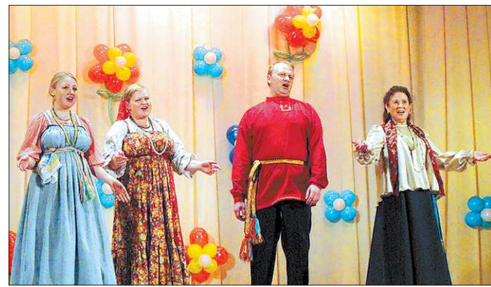
Обладатели Гран-при уверены, что в жизни всегда есть место для народной песни