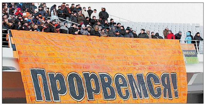
Болельщики «Урала» в успехе своих любимцев не сомневаются

Несмотря на то, что большее количество солистов и коллективов представляли Свердловскую область, Гран-при конкурса уехал всё-таки к соседям-челябичанам. Главный приз получил фольклорный ансамбль «Негрустиночка» из города Миньяр. Коллектив, существующий уже не одно десятилетие, не похож ни на ко-