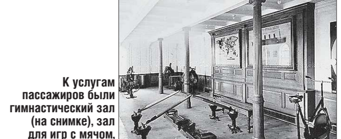
К услугам пассажиров были гимнастический зал (на снимке), зал для игр с мячом, теннисный корт, бассейн...