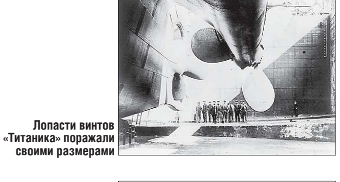
Лопастей винтов «Титаника» поразили своими размерами