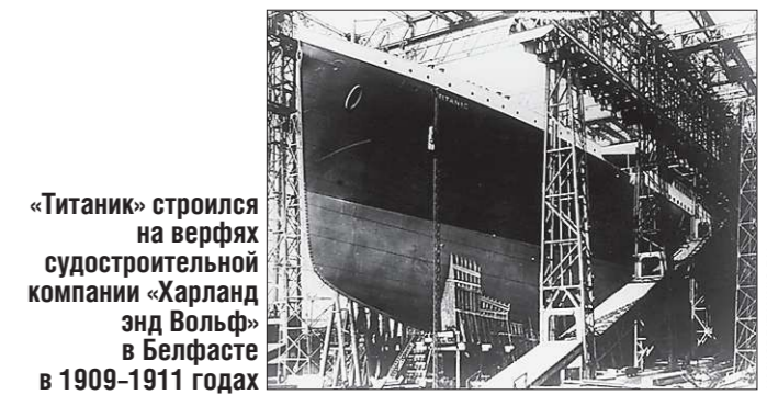
«Титаник» строился на верфях судостроительной компании «Харланд энд Вольф» в Белфасте в 1909-1911 годах