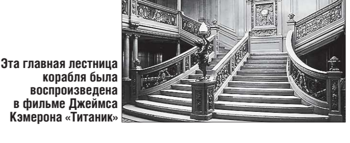
Эта главная лестница корабля была воспроизведена в фильме Джеймса Кэмерона «Титаник»