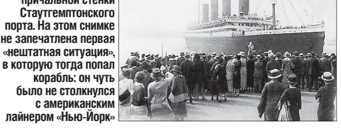
10 апреля 1912 года «Титаник» отходит от причальной стенки Стаутемптонского порта.