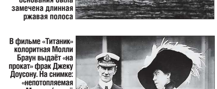
В фильме «Титаник» колоритная Молли Браун выдаёт «на прокат» фразе Джону Дугану. На снимке: «непотопляемая Молли» (так её прозвали после катастрофы) вручает капитану «Карпатии» Артуру Роструну кубок любви от оставшихся в живых пассажиров «Титаника»