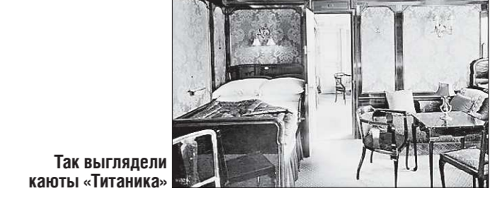
Так выглядели каюты «Титаника»