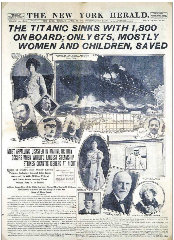
«Карпатия» со спасёнными пассажирами «Титаника» ещё была на пути в Нью-Йорк...

«Титаник» и «Олимпик» в порту Белфаста: один готовится к отплытию, другой прибыл на ремонт после аварии.