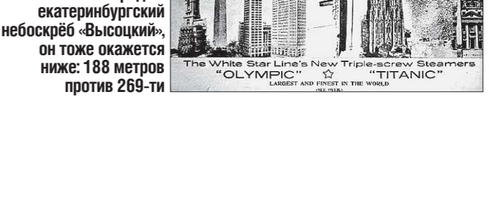
Длина «Титаника» превышала высоту наиболее известных небоскрёбов того времени. Кстати, если поместить рядом екатеринбургский небоскрёб «Высоцкий», он тоже окажется ниже: 188 метров против 269-ти