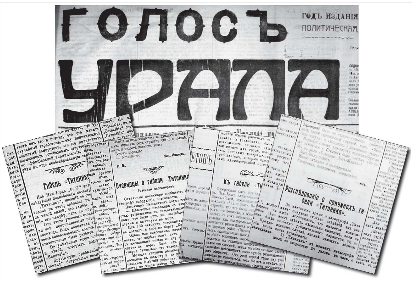
Катастрофа в Атлантике весной 1912 года стала одной из главных тем екатеринбургской газеты