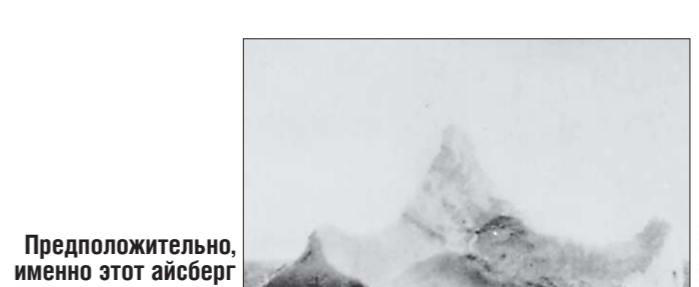
Предположительно, именно этот айсберг стал виновной гибели «Титаника» - у его основания была замечена длинная ржавая полоса