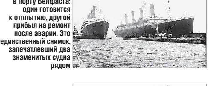
«Титаник» и «Олимпик» в порту Белфаста: один готовится к отплытию, другой прибыл на ремонт после аварии.