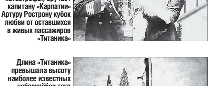
Длина «Титаника» превышала высоту наиболее известных небоскрёбов того времени.