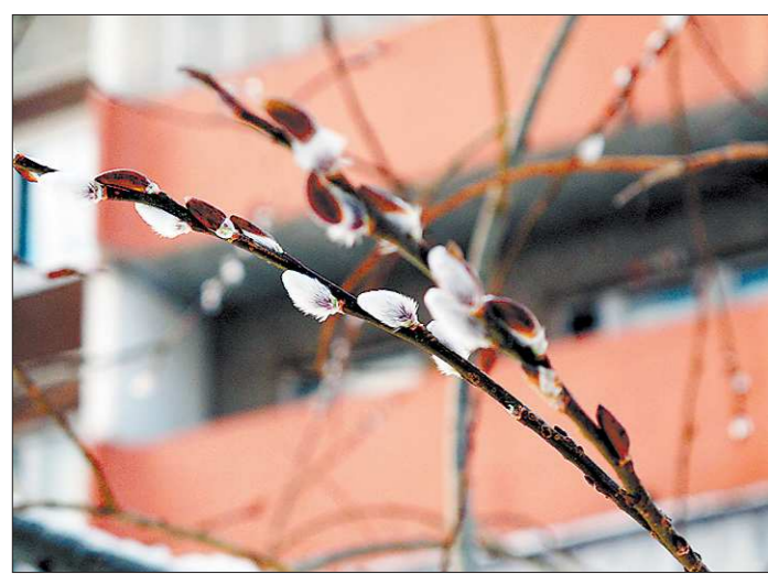
В минувшие выходные православные отмечали Вербное воскресенье (вход Господень в Иерусалим). В этом году священное дерево распустилось немного раньше праздника