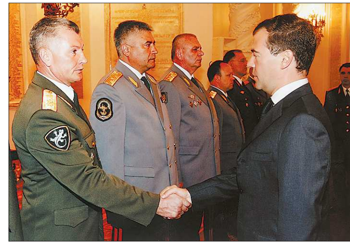
На приеме у Президента России в Кремле

— Отвечу так: из наших войск военнослужащие по призыву не бегут. То есть нет таких ситуаций, когда допек