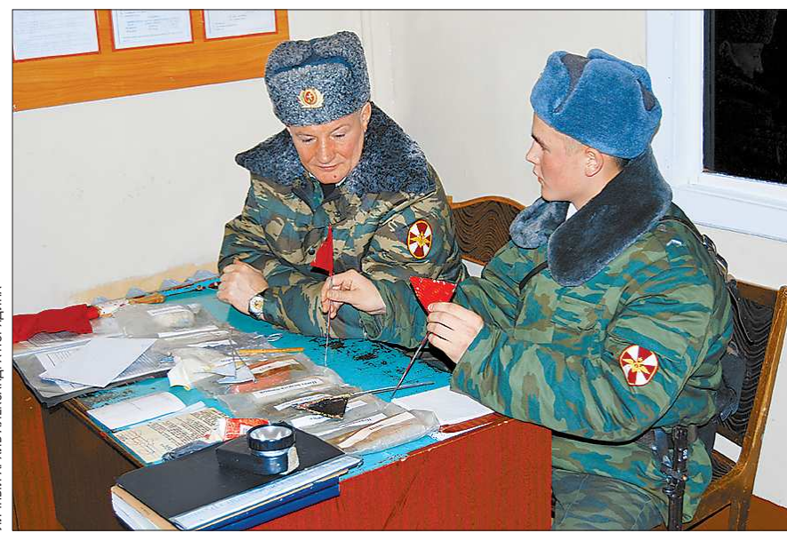
Командующий заглядывает в учебный класс на заставе одного из ЗАТО