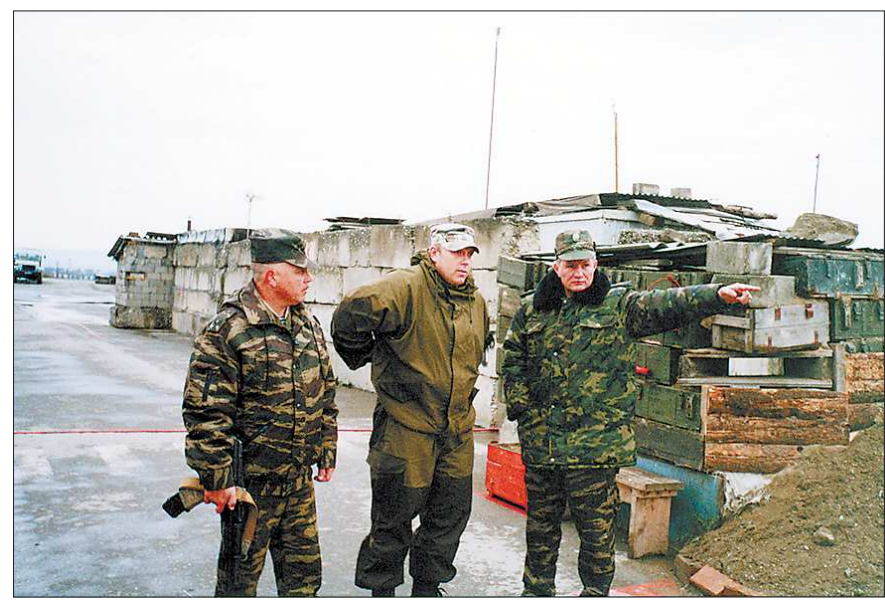
Чечня. Командующий войсками (справа), как всегда, дотошен во всё