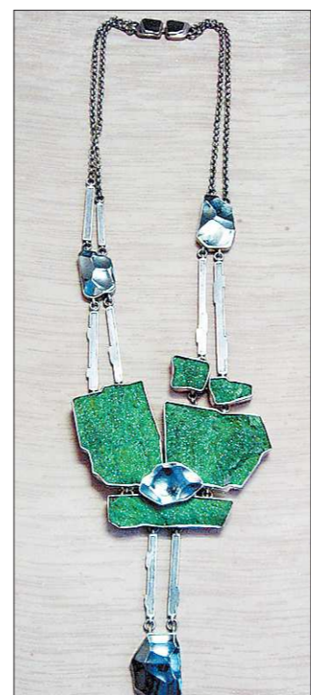
В его работах металл, камень, дерево, стекло никогда не спорят