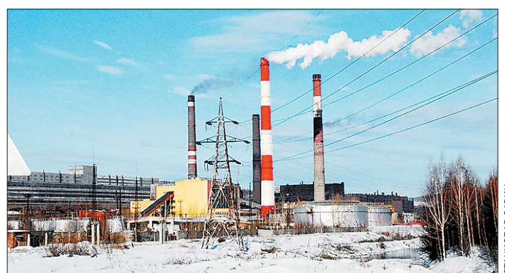
Некоторые оборудование Богословской ТЭЦ старше самой станции

Получение права на производство строительных, проектных работ по допуску СРО в составе Консолидированной Группы Полных Товариществ (Москва, г. Оренбург, г. Екатеринбург, г. Новосибирск). Опыт работы 3 года; в составе 60 участников. Строительные – 27000 рублей. Проектные – 15000 рублей. Тел.: (3537) 675-277, (3537) 60-17-40. Сайт: www.ptstroyka.ru.