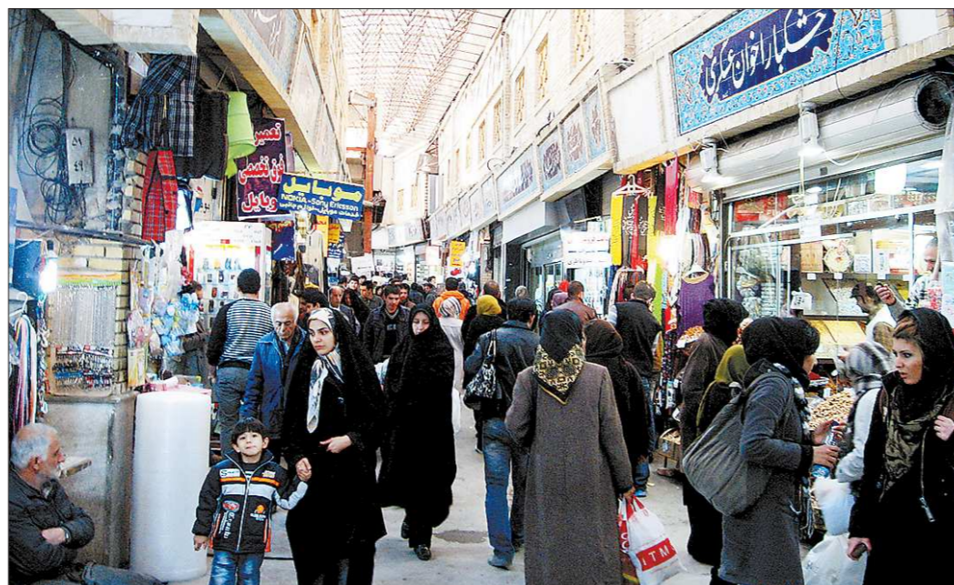
На восточном базаре