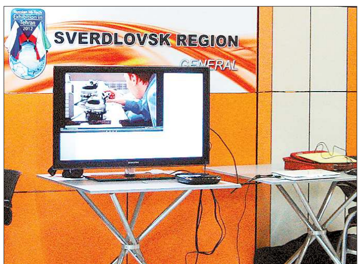
Иранцы хотели посмотреть возможности Свердловской области не только на мониторе

Телевидение Иранское телевидение, честно говоря, показалось скучным, может, из-за незнания языка. Идут по нескольким каналам религиозные и аналитические программы, научно-популярные передачи, художественные фильмы, есть спортивные каналы. Видел даже парочку американских фильмов двадцатилетней давности, малоизвестных и каких-то пресных. Конечно, иранское ТВ отличается от нашего с его засильем попов, скандальных юмором, пошлыми телешоу, картонными бесконечными сериалами «о семейных ценностях» и бесконечным потоком кривизны и криминала.