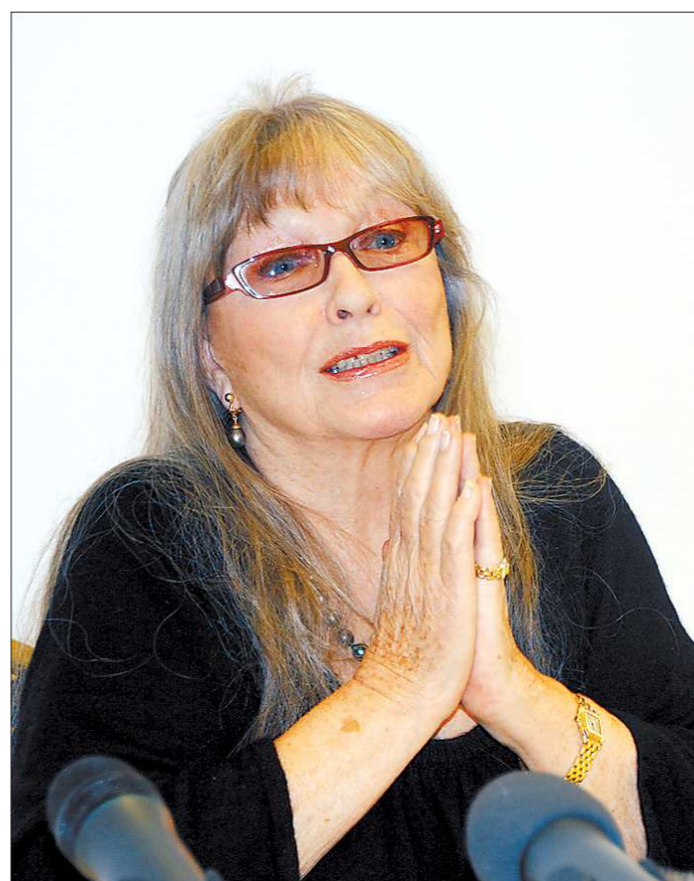
В Екатеринбурге побывала Марина Влади — с моноспектаклем «Владимир, или Прерванный полёт»