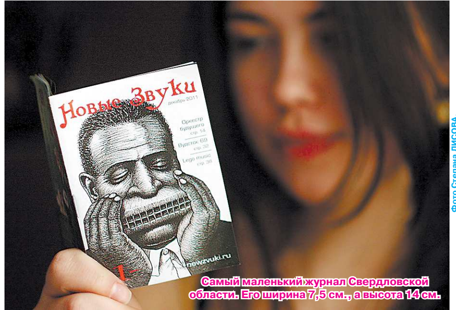
Самый маленький журнал Свердловской области. Его ширина 7,5 см., а высота 14 см.