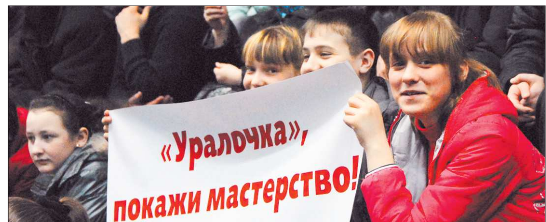
Выполнить просьбу своих болельщиков свердловские волейболистки не сумели

«Нижний Новгород», «Алания», «Мордовия» — по 77 очков, «Шинник» — 75, «Динамо» (Бр) — 66, «Сибирь» — 65, «Урал» — 61, «Торпедо» — 60.