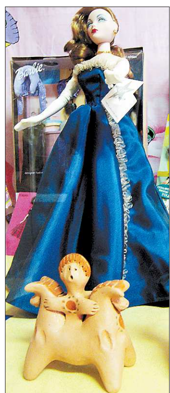
Куклы разные нужны

Все кукольные роли можно рассмотреть в новой экспозиции. Почти целый зал отдан под сувениры, привезённые со всех стран и континентов, в национальных одеждах, символи-