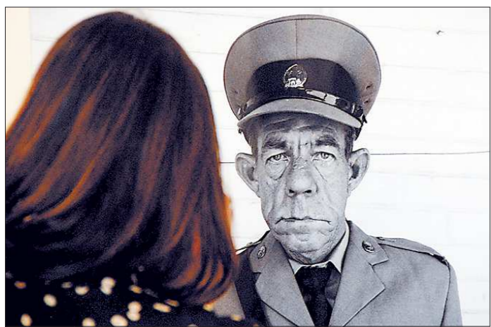
«Сержант Де Бруин» – Роджера Баллена привлекают характерные, странные и запоминающиеся лица