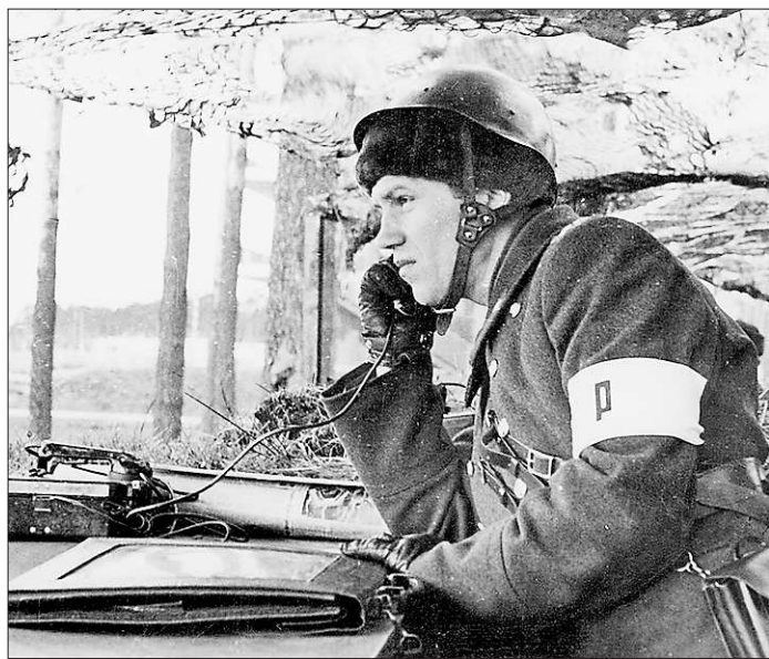
На командном пункте полка. 1975 год, Восточная Германия