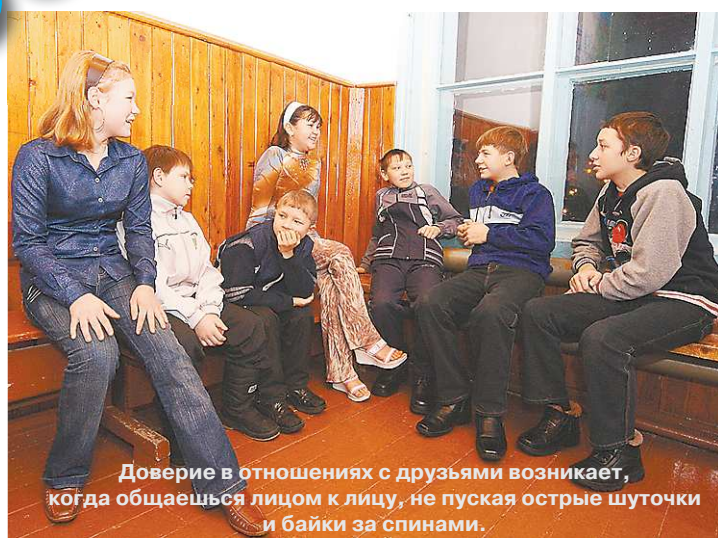
Доверие в отношениях с друзьями возникает, когда общаешься лицом к лицу, не пуская острые шуточки и байки за спинами.

Фэйк (от англ. fake – подделка) – в широком смысле слова любая подделка, выдаваемая за настоящую вещь.