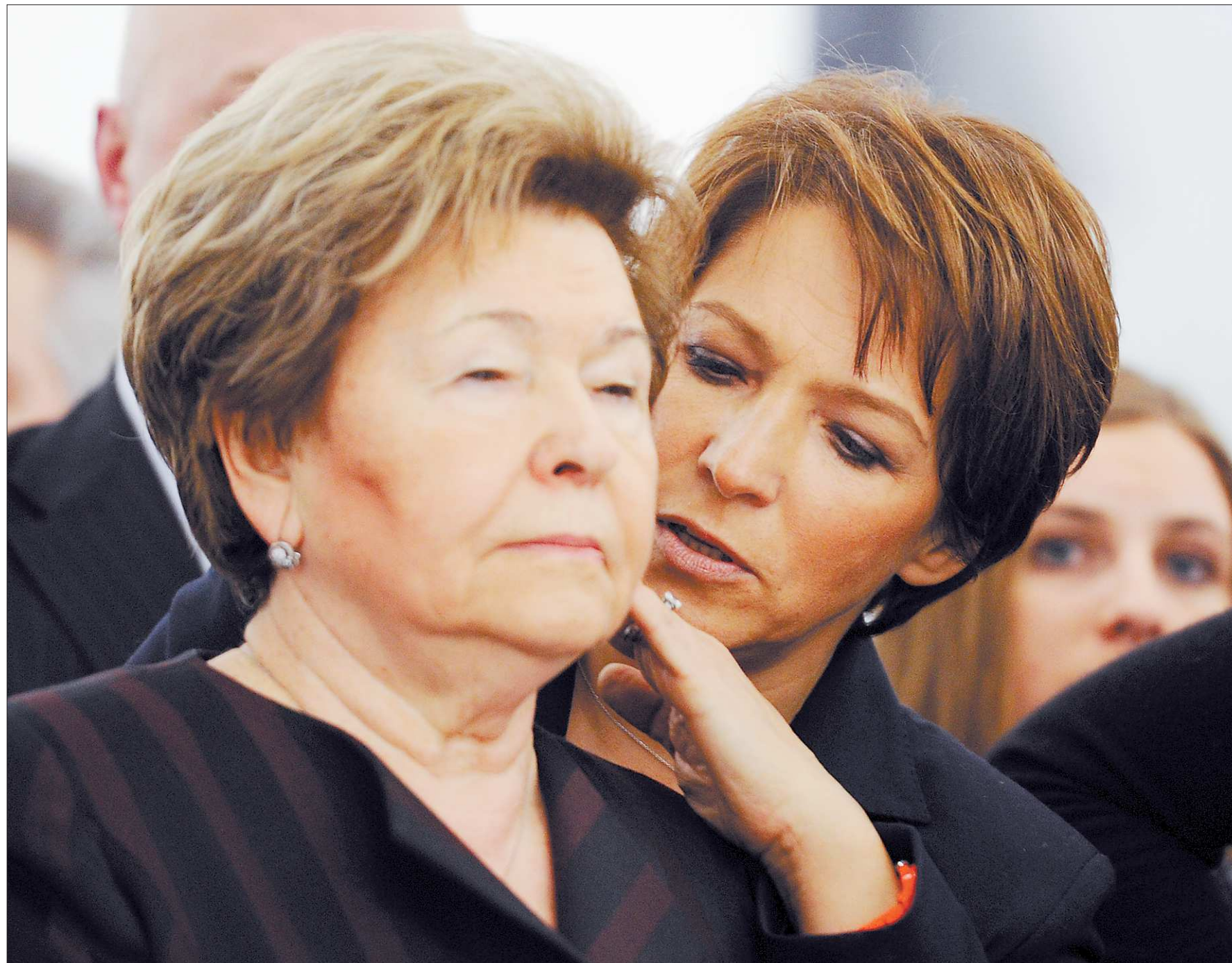
Январь 2011-го. Наина Ельцина с дочерью Татьяной Юмашевой на пресс-показе выставки «Борис Ельцин и его время» в Московском доме фотографии

Наина Иосифовна уже жила в Москве, когда в Свердловске «советские люди» стали выходить на улицы, требуя демократии и защищая её мужа. Автор этих строк был очевидцем тех митингов и готов засвидетельствовать: на площади 1905 года, на пятке к Дворцом молодёжи, на пустыре у «Космоса» стояли, в значительной мере, именно те 50–55-летние женщины-инженеры, ещё недавно вышедшие на первомайские