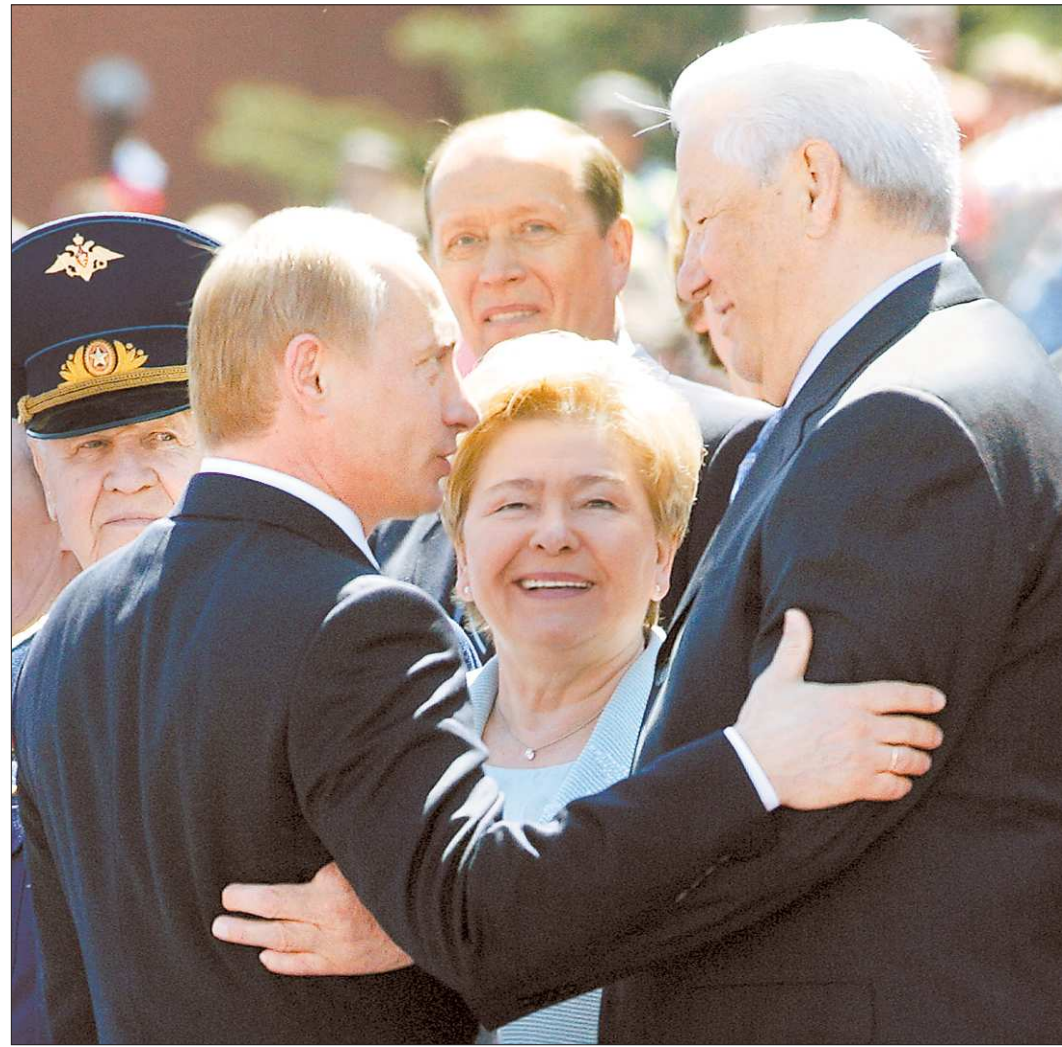
12 июня 2004 года. Президент России Владимир Путин, Наина Ельцина и первый президент России Борис Ельцин во время празднования Дня России на Красной площади

До президентских выборов 1996 года оставалось около трёх недель, когда в Кремль прибыла делегация воюющей Чечни. Вероятно, многие помнят кадры бурного начала тех переговоров: Яндарбиев категорически возражает против предложенного плана раскладки за столом, требует, чтобы российский пре-