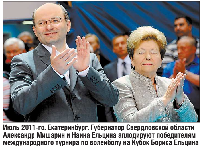
Июль 2011-го. Екатеринбург. Губернатор Свердловской области Александр Мишарин и Наина Ельцина аплодируют победителям международного турнира по волейболу на Кубок Бориса Ельцина