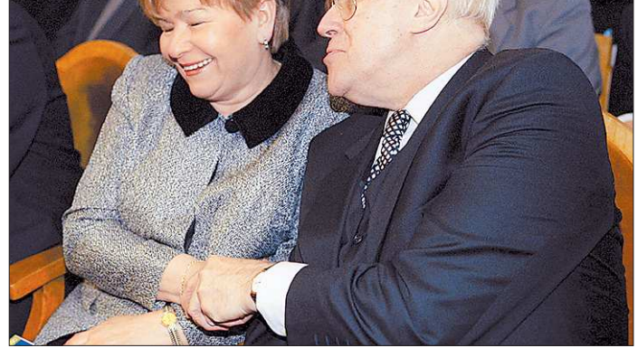
Май 1997-го. С Мстиславом Ростроповичем в Большом зале Московской консерватории