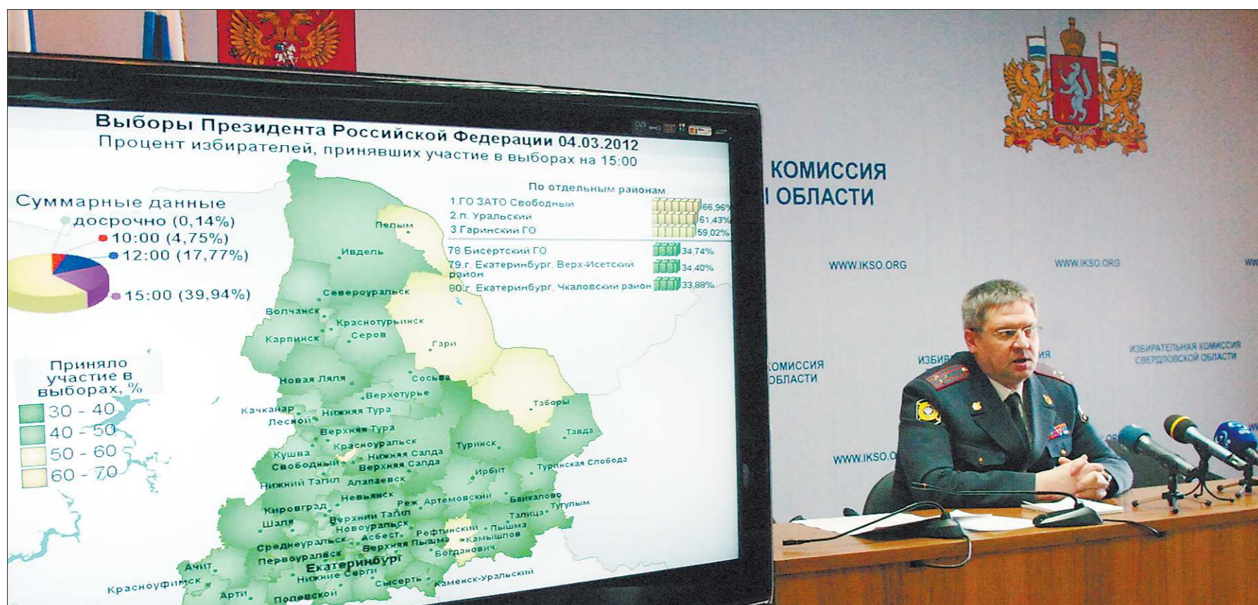
Для обеспечения безопасности на 2537 избирательных участках Свердловской области было направлено 6697 сотрудников полиции

В Свердловской области обработано 99 процентов бюллетеней, поданных избирателями на выборах Президента России. Согласно этой информации, за Владимира Путина проголосовали 1 337 781 человек (64,51 процента). Второе место занимает Геннадий Зюганов — 251 630 свердловчан (12,14 процента). На третьем месте — Михаил Прохоров — 237 780 голосов (11,46 процента). Четвертую строчку занял Сергей Миронов — 113 353 голоса (5,46 процента). Пятое место досталось Владимиру Жириновскому — 107 819 человек (5,2 процента). Наибольший процент голосов Владимир Путин получил в Староуткинске (84,86 процента), наименьший — в Кировском районе Екатеринбурга (54,55). В Дзержинском районе Нижнего Тагила, где находится Уралвагонзавод, коллектив которого выступил организатором масштабной поддержки российского премьера, за Путина проголосовало 69,66 процента избирателей.