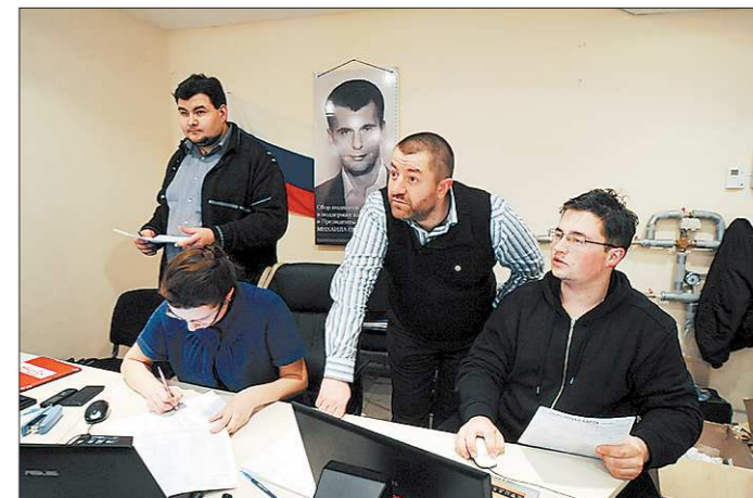
Кандидат Михаил Прохоров после окончания голосования заявил, что будет разочарован, только если займёт последнее место. В его общественной приёмной в Екатеринбурге нам сообщили, что заметили множество нарушений, однако результат своего кандидата по уральской столице считают неплохим