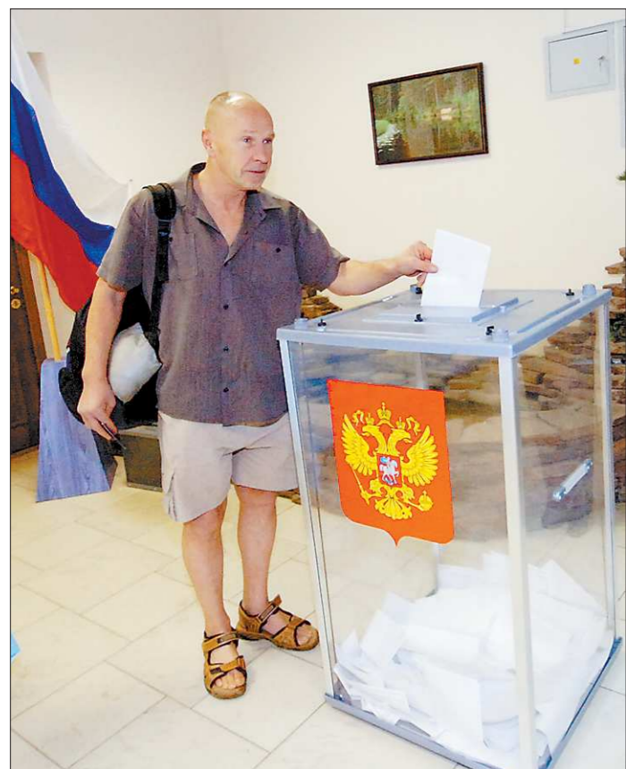
Для членов избирательной комиссии на одном из участков для голосования самым неожиданным оказалось появление последователя Порфирия Иванова