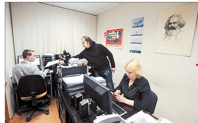
КПРФ итогами выборов, как водится, опять недовольна. Местное отделение партии мнение своего лидера поддерживает, хоть и спокойнее. В ночь выборов в екатеринбургском штабе коммунистов нам признались, что для них сейчас главное, чтобы Зюганов обогнал Прохорова по Свердловской области