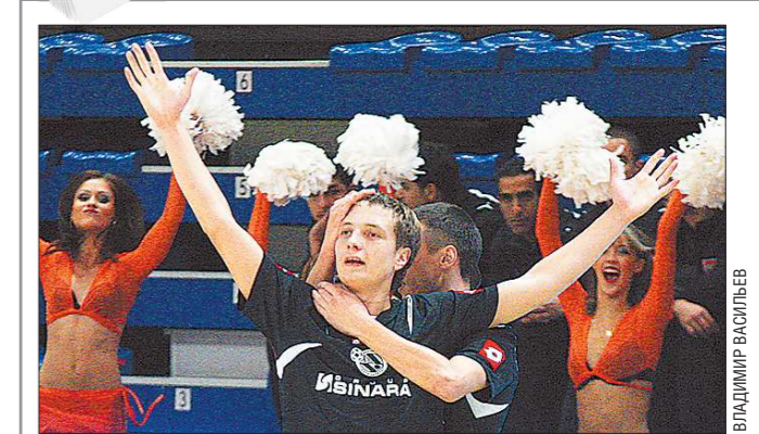
20 лет назад (в 1992 году) в Екатеринбурге был основан мини-футбольный клуб «Синара» — самый уникальный спортивный коллектив в нынешней России.

Уникальность «Синары» заключается в том, что она (вопреки всем тенденциям современного спорта) почти на 100 процентов формируется из собственных воспитанников, подавляющее большинство которых — уроженцы Екатеринбурга и Свердловской области. Иностранцы футболисты в составе команды за всю её историю было меньше, чем пальцев на одной руке (сейчас, например, нет ни одного), а уроженцы других регионов России играли в клубе в основном на заре его существования.