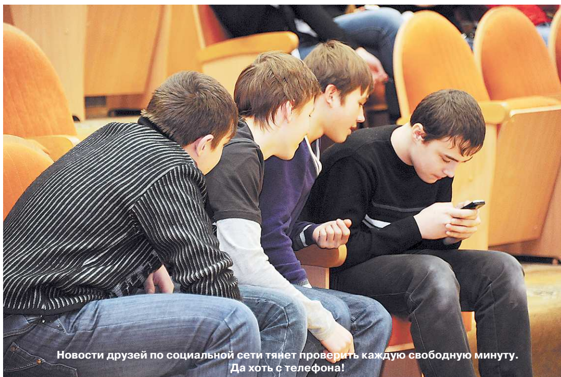
Новости друзей по социальной сети тянет проверить каждую свободную минуту. Да хоть с телефона!