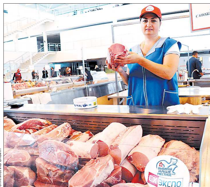
К изобилию привыкли, хочется повкуснее и подешевле...

Напомним, в середине 2011 года губернатор Свердловской области Александр Мишарин предложил переоборудовать выставочный павильон на улице Громова в рынок для сельхозпредприятий Среднего Урала, где бы цены