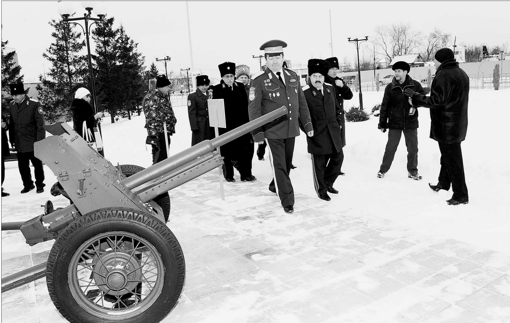
Верхняя Пышма. В музее боевой техники под открытым небом собраны уникальные экспонаты

Начало музею было положено в 2005 году, когда ветераны завода «Уралэлектромедь» обратились к руководству холдинга «УГМК» с просьбой о закупке трёх раритетных единиц военной техники. Сейчас в музее «Бо-