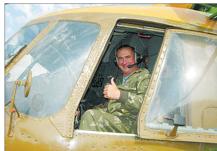
Если надо, Герой России полковник Олег Касов и вертолёт в воздух поднимет