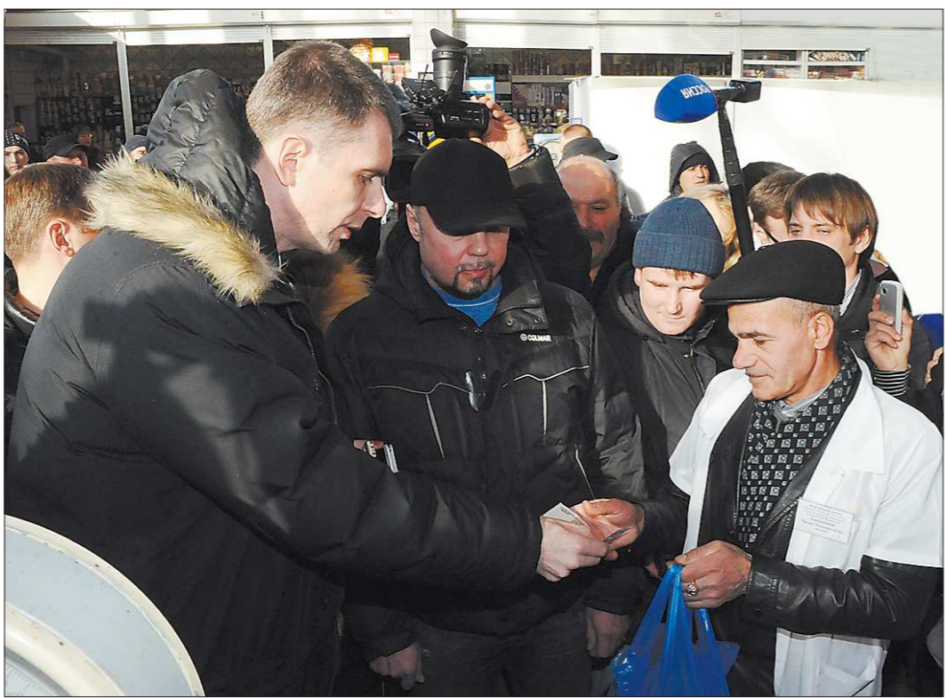
Продавец яблок на Шарташском рынке скидку миллиардеру Прохорову не сделал

Спрашивали о разном: одних волновали проблемы мирового масштаба, других — частного характера. Разумеется, не смогли екатеринбуржцы (а точнее — екатеринбурженки) под общий смех не затронуть и тему личной жизни Михаила Прохорова. Он в очередной раз признался, что «сердце его открыто». Встреча длилась почти два с половиной часа, под конец зрители уже заметно устали, да и замёрзли, поскольку в этом