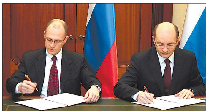
Согласно подписанным соглашениям, налоги с доходов предприятий «Росатома» пойдут на развитие закрытых городов

№ 65-66 (6121-6122). Цена в розницу — свободная.