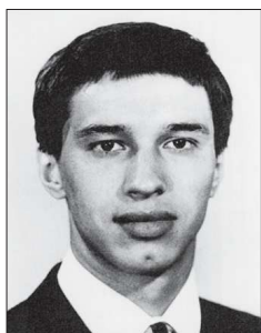
Игорь Малков — самый молодой олимпийский чемпион в истории конькобежного спорта. В день победного старта уральцу было 19 лет и 9 дней

Сейчас Игорь Малков живёт в родном городе, где работает инспектором ГИБДД.