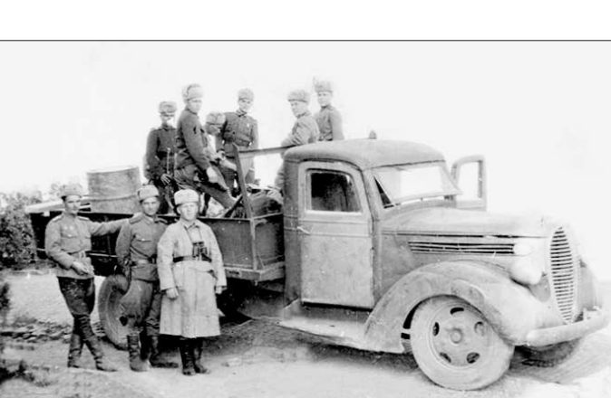
1945 год. Монголия. Война закончилась, но до возвращения домой было ещё далеко

Общение. В нашем возрасте это уже самое главное. Ради этого проводим все наши мероприятия — соревнования, праздники, встречи с молодёжью.