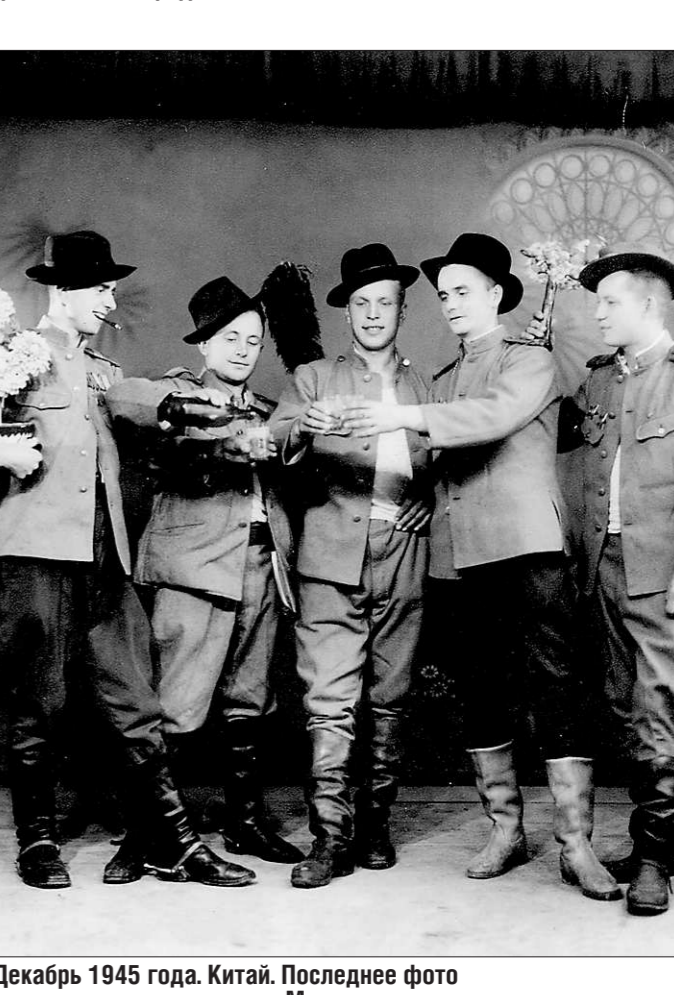
Декабрь 1945 года. Китай. Последнее фото с друзьями-разведчиками. Модные шляпы — это реквизит фотосалона