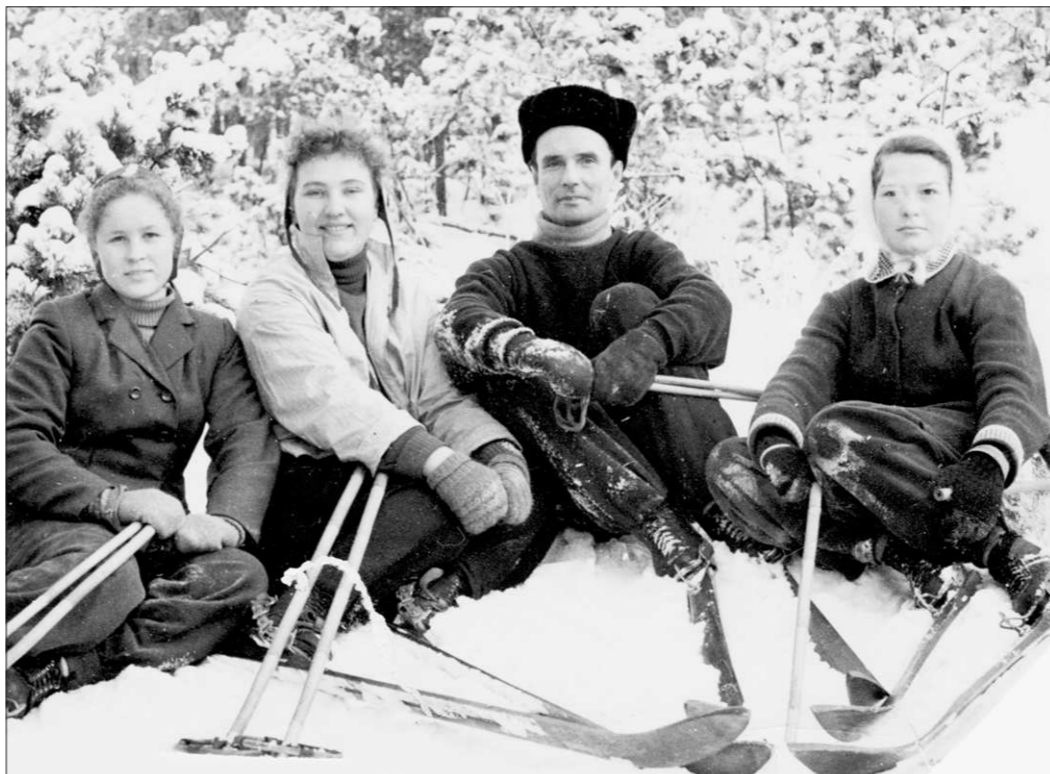
1957 год. С инструкторами физкультуры — участниками профсоюзного семинара

Попали вы в 144-ю отдельную разведроту 243-й Никопольско-Хинганской дивизии. С этой ротой мы освободили Никополь, Одессу (в том числе выбивали немца Потёмкинскую лестницу) и от знаменитого оперного театра), Молдавию, Бухарест, че-