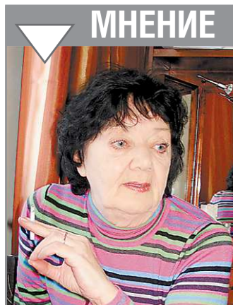
Галина УМПЕЛЁВА, ведущая актриса Свердловского театра драмы, народная артистка России