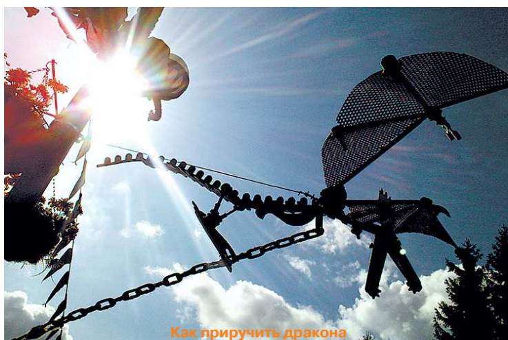
Как приручить дракона

Спецвыпуск «Областной газеты» — «Новая Эра» для детей и подростков Выходит с апреля 2000 года. Сегодня вы прочитали выпуск № 549. Следующий номер выйдет 18 февраля. Пишите! Звоните! Адрес редакции: 620004, г. Екатеринбург, ул. Малышева, 101. «Областная газета» – «Новая Эра». Тел.: (343) 375-80-33; тел. и факс 374-57-35. ne@oblgazeta.ru