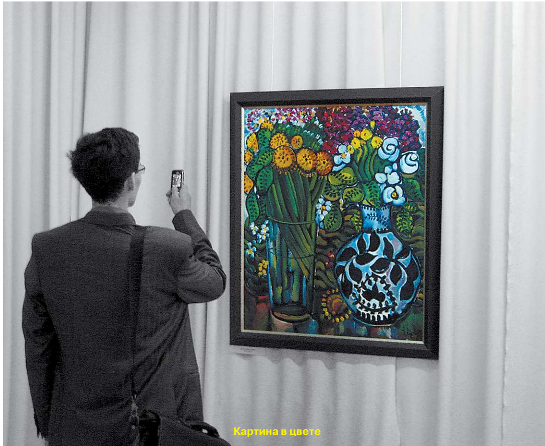
Картина в цвете