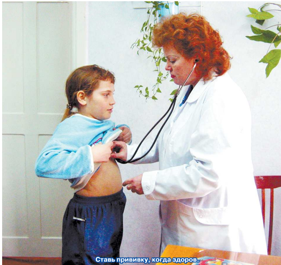
Ставь прививку, когда здоров.

Поэтому в любом случае, прививку лучше сделать. Хуже от этого точно не будет.