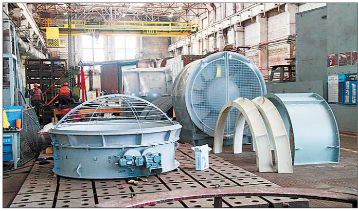
В 2010 – 2011 годах на «Вентпроме» модернизировали несколько цехов и освоили производство новых вентиляторов

Первой площадкой для посещения стала школа №56. Когда-то в ней учился Александр Мишарин, потому артёмовцы называют школу «губернаторской». В настоящее время от старой постройки почти ничего не осталось, в соответствии с проектом реконструкции завершён монтаж каркаса нового здания. Уже ведётся монтаж внутренних инженерных сетей, на верхних этажах маляры приступили к отделочным работам, а в газовой котельной, которая будет отапливать школу, начались пусконаладочные мероприятия. «Данный проект уникальный. Помимо учебных классов и кабинетов для дополнительного образования, здесь будет огромный спортзал и даже зимний сад. Более того, артёмовская школа № 56 станет самой большой в Свердловской области, в ней смогут учиться более 800 детей в одну смену», – отметил региональ-