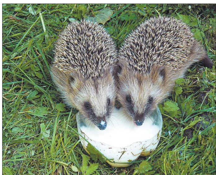
Несмотря на колючки, ежи тоже могут быть романтической парой

Отметим, что победителям конкурса на лучшую пару вручат любимое лакомство.