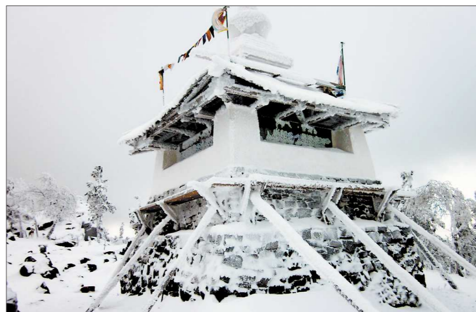
На горе высотой почти 900 метров храм смотрится как НЛО