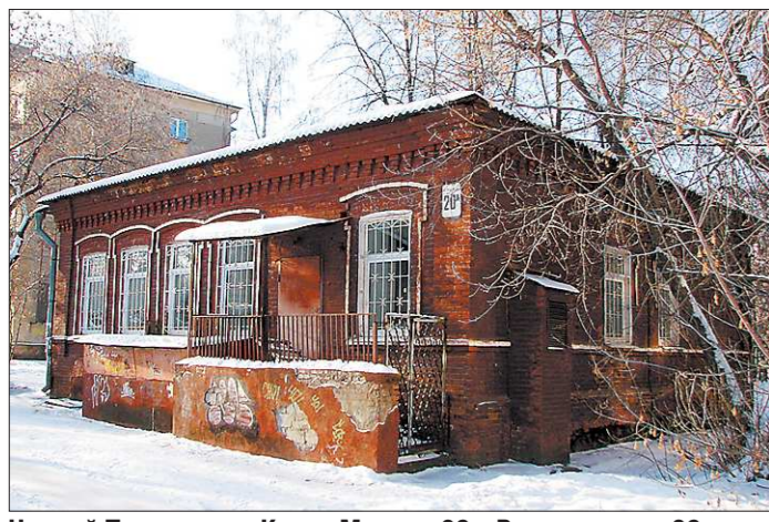
Нижний Тагил, улица Карла Маркса, 20а. В этом доме в 30-е годы прошлого столетия жила семья Шалвы Окуджавы