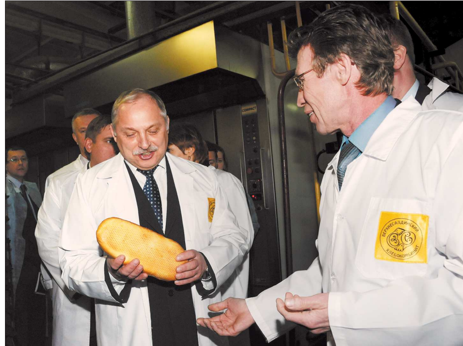
Хлебокомбинат производит десятки различных видов хлеба. Среди них есть фирменные разработки, например, батон «Салдинский»

— Вопрос о передаче здания госпиталя в собствен-