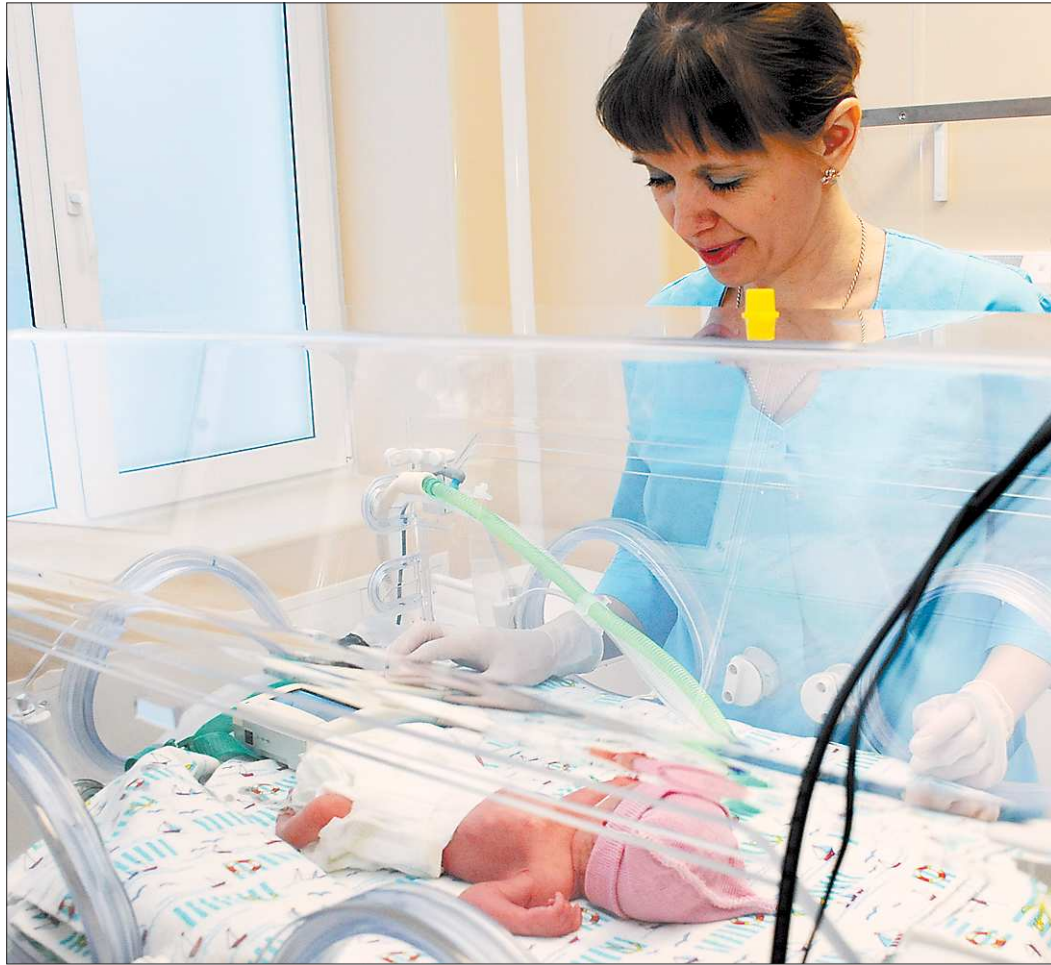
Демографический взрыв Верхней Салде не страшен. В прошлом году в городе появились на свет более 500 малышей. «Производственные мощности» нового роддома рассчитаны с запасом

— Это один из немногих объектов, по поводу которых не возникло никаких споров среди депутатов областного Законодательного Собрания. Решение о выделении денег было принято единогласно,