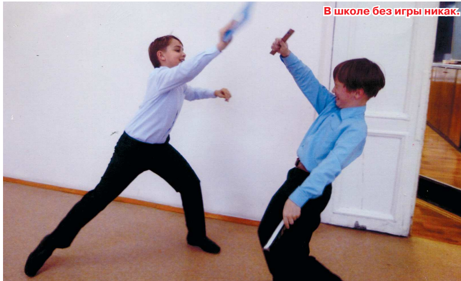
В школе без игры никак.