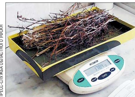
Эта марихуана хранилась у входной двери в мешке из-под картошки

Накануне оперативники Краснофимского межрайонного отдела Управления ФСКН России по Свердловской области задержали в деревне Полднева Артинского района 50-летнего неработающего местного жителя (больше полпутора килограмма).